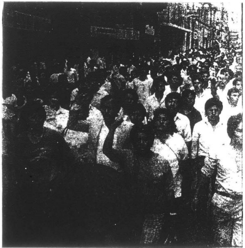
En el presente año, las luchas del sindicalismo clasista se han impuesto sobre las que han sido encabezadas por el revisionismo.

perspectivas reales de estabilidad económica y política", expresando la opinión inglesa.