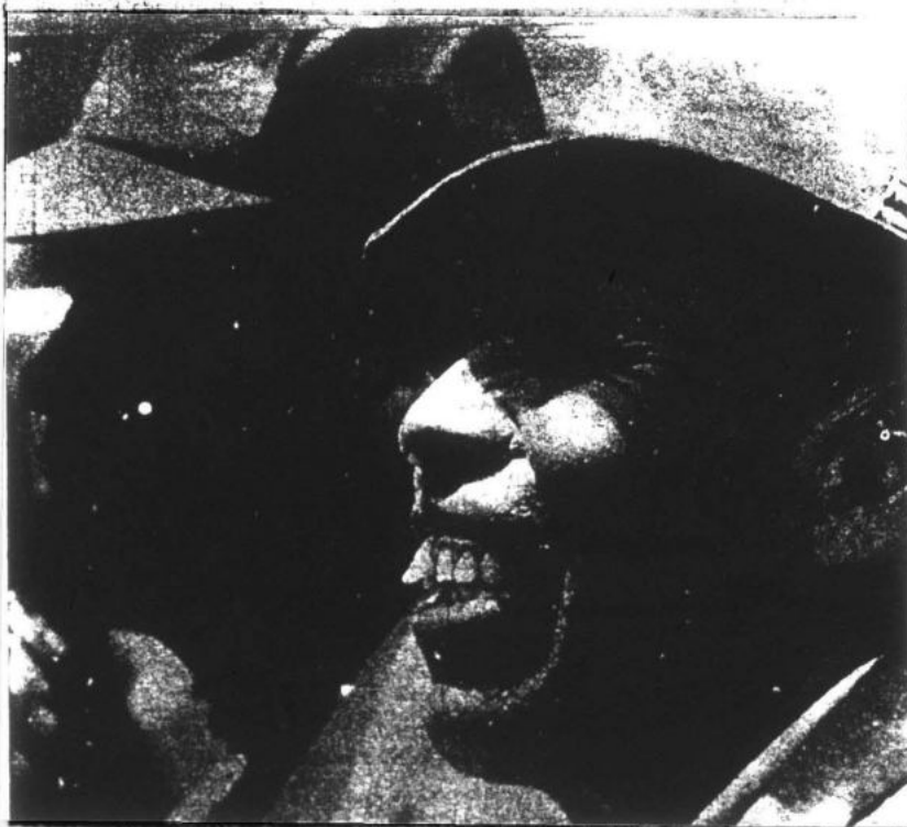
El campesinado peruano, al lado del proletariado y la pequeña burguesía, luchando por la conquista del poder.