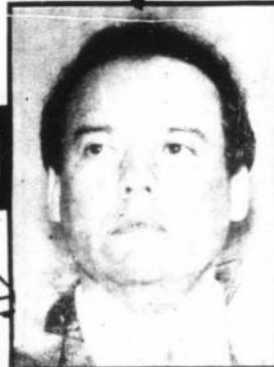
LUIS ALVA CASTRO