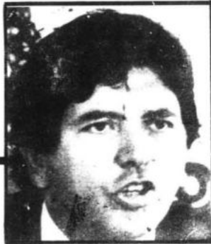
ALAN GARCIA PEREZ