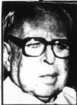
LUIS ALBERTO SANCHEZ