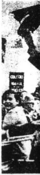
El Plan de Desarrollo "democracia repres...