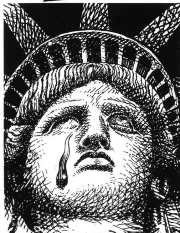
"En una sociedad semifeudal y semicolonial como la peruana, el imperialismo yanqui introdujo sus modalidades de organización".

Las condiciones políticas internacionales que golpearon al imperialismo yanqui y su crisis económica frustraron en gran medida su Alianza, replanteándose en dos cuestiones capitales: la re-